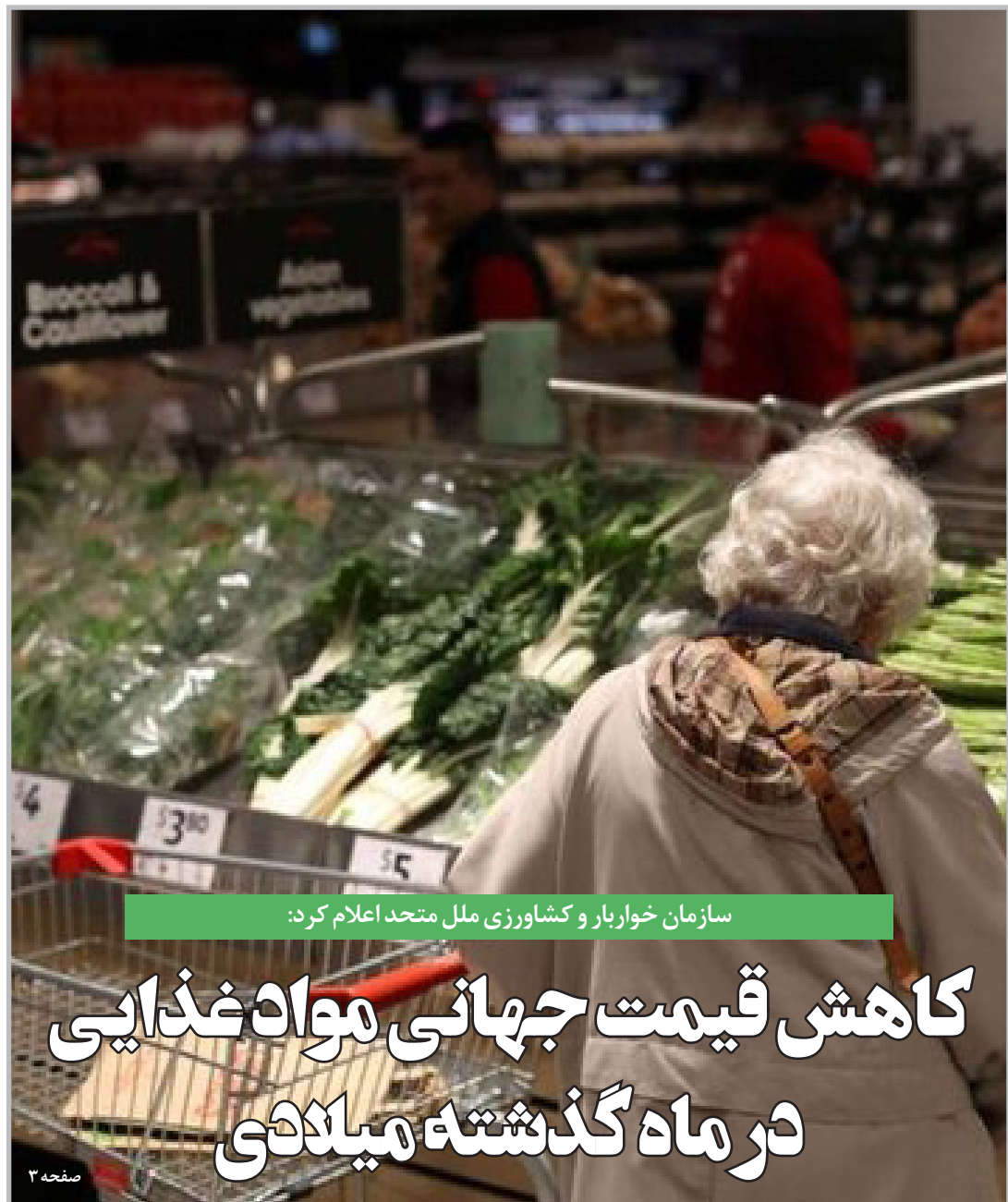
سازمان خواربار و کشاورزی ملل متحد اعلام کرد: